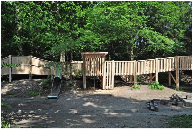
Der neue Spielplatz ist 48 Meter lang und 42 Meter breit, der Turm ist 7 Meter hoch