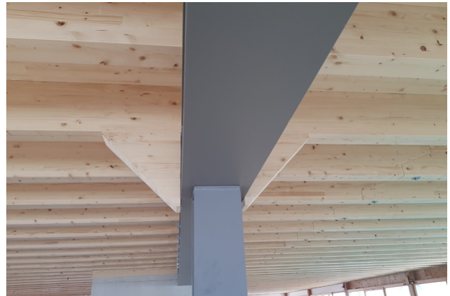
Kombination von Stahltragwerk und Holzbau