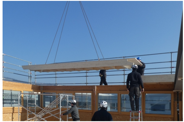
Anbringen eines Dachelements