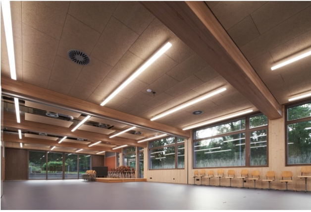
Mehrzweckraum mit den Unterzügen aus Buchenholz und den Falltrennwänden