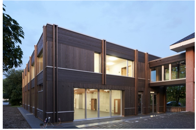
Westfassade mit der sieben Meter breiten Fensterfront und der Passerelle in den Altbau