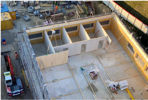
Montieren der Innenwände