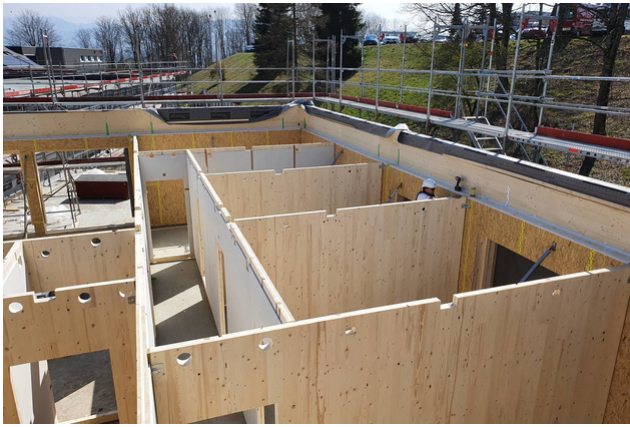
Innenwände in Brettsperrholz