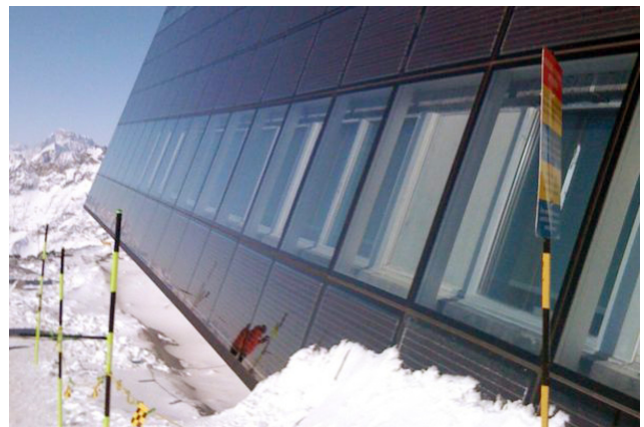
Fassade mit Fotovoltaik