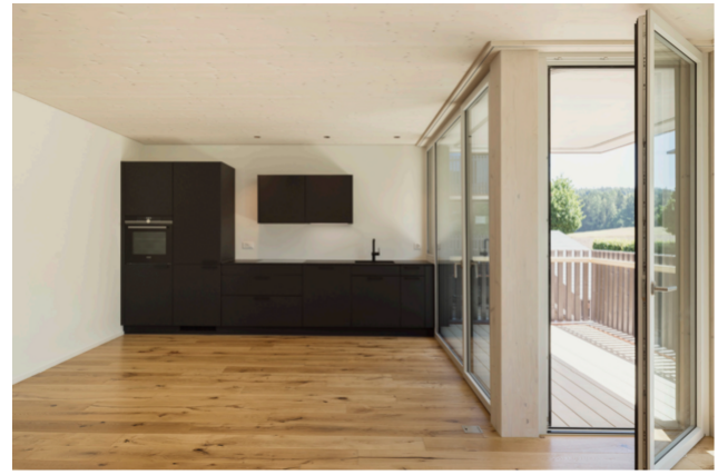
TS3-Konstruktion im fertigen Zustand