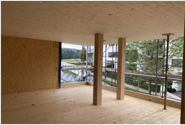
TS3-Konstruktion in der Bauphase