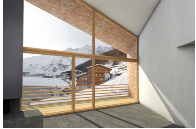
Aussicht nach Westen