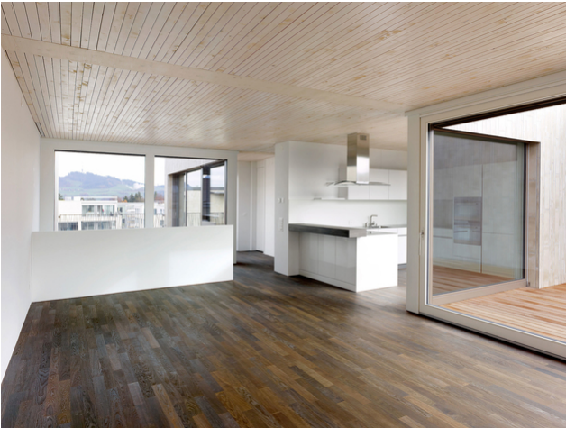
Wohnzimmer und Küche