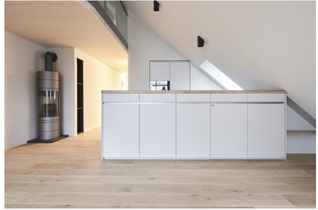
Küchenbereich mit Schwedenofen