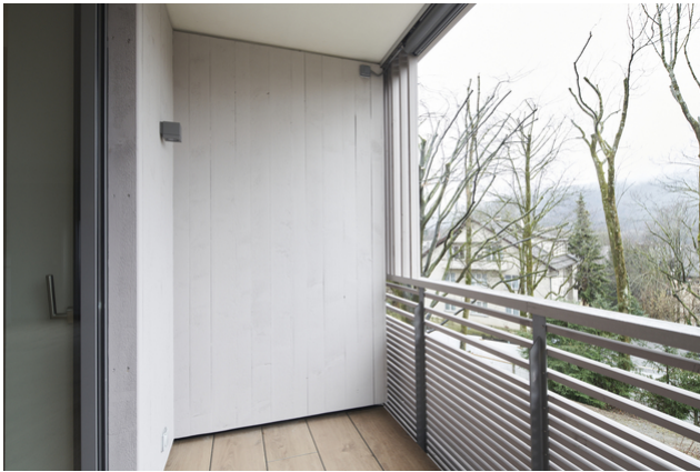
Holz an der Fassade und an den Balkonen