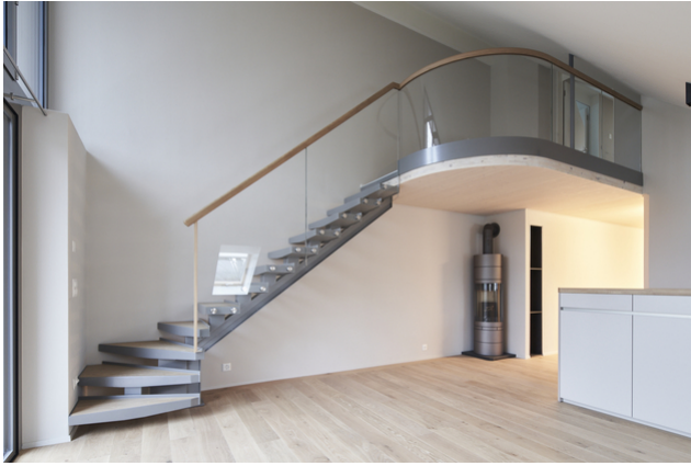
Galerie der Maisonnetewohnung