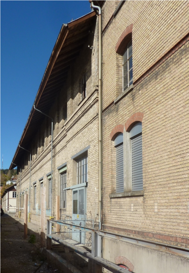
Die Fassaden sind teilweise denkmalgeschützt.