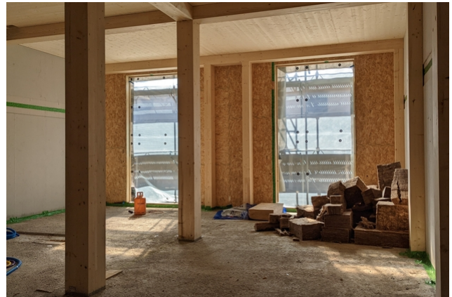
Dahinter entsteht der neue Holzbau.