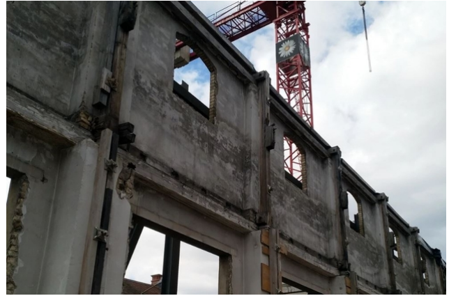
Das Gebäude wurde bis auf seine Fassade rückgebaut.