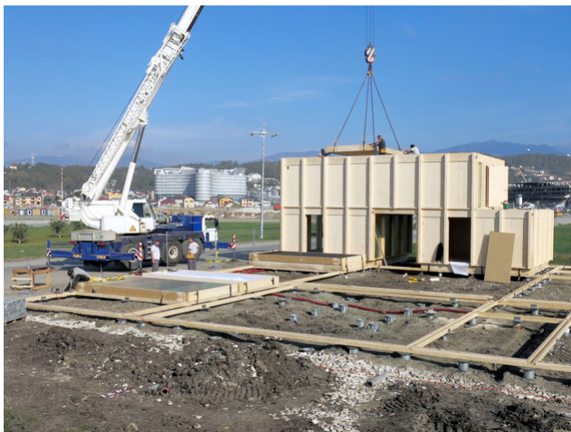
Montage in Sochi

Das Gebäude-Ensemble besteht aus 4 Gebäuden mit bis zu drei Geschossen, deren Gesamtsilhouette die Modernität der aktuellen Schweizer Holzarchitektur evoziert. Damit will «Präsenz Schweiz» der Welt ein Baudokument vor Augen führen, das Tradition mit zeitgenössischer Schweizer Architektur und Design verbindet, gebaut mit dem «einzigsten nachwachsenden Rohstoff» der Schweiz – Holz.