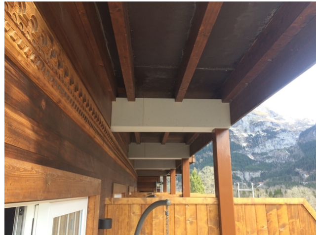
HEB Träger verkleidet