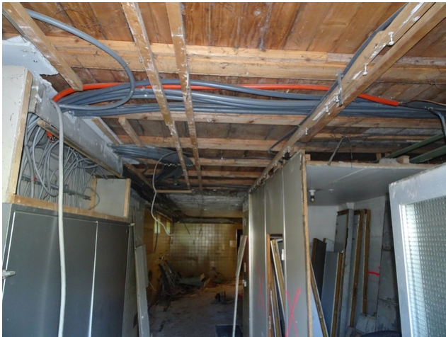
Decke vor der Ertüchtigung