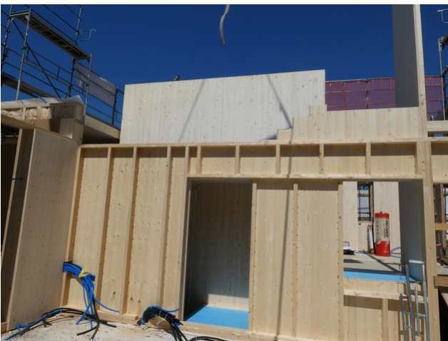
Montage der Holzbauelemente