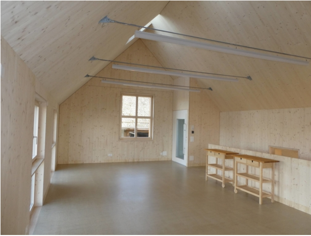
Zugstange zur Aufnahme der statischen Kräfte