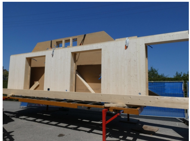
Anlieferung der Holzbauelemente