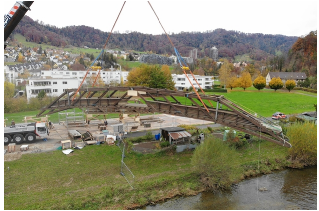
Montagearbeiten an der Brücke