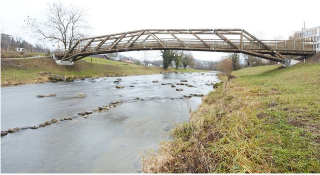
Der neue Tüfisteg