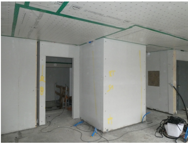
Gekapseltes Treppenhaus in der Bauphase