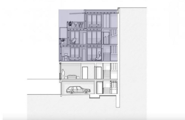
Querschnitt der Aufstockung