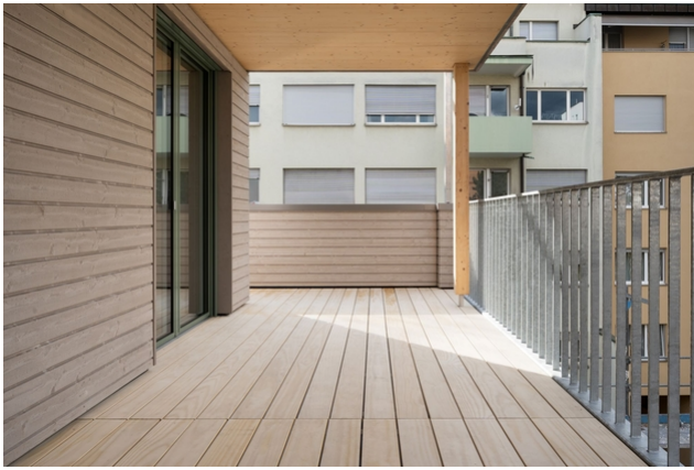
Terrasse 3. OG