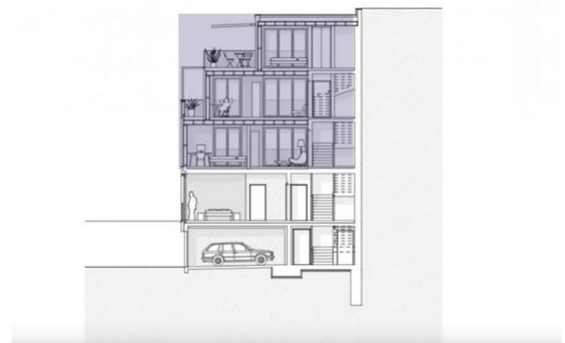
Querschnitt der Aufstockung