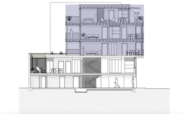
Längsschnitt der Aufstockung