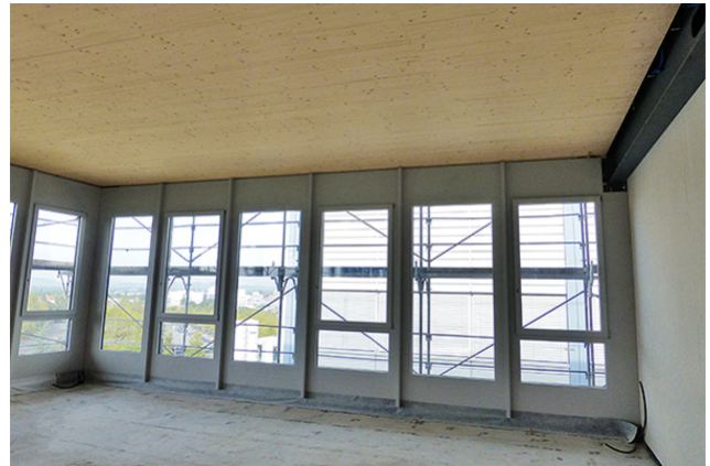
Holzdecke mit 9m Spannweite