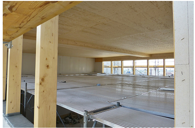
Deckenatrium mit 12m Spannweite