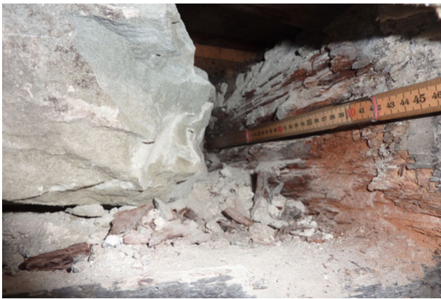
Support de poutres de plafond dans le mur extérieur de la cave à vin avant la rénovation