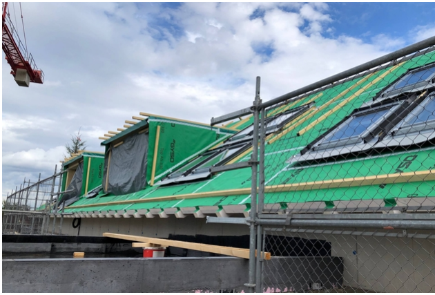
Surélévation en cours de construction