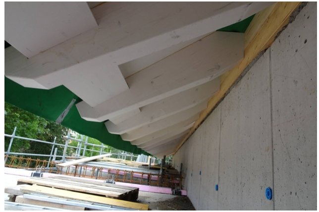
Avant-toit côté gouttière avec sticher