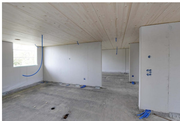
Vue intérieure sur le chantier avec le plafond de l'étage en bois