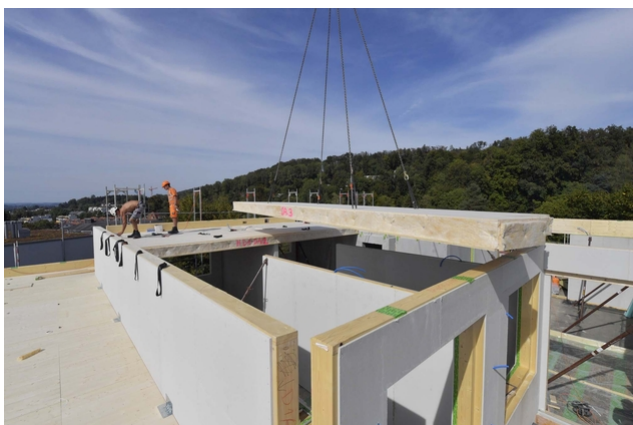
Travaux de redressement avec la grue