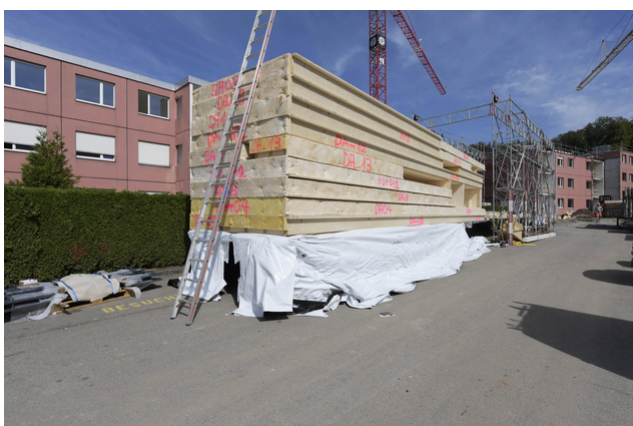
Livraison des éléments en bois préfabriqués