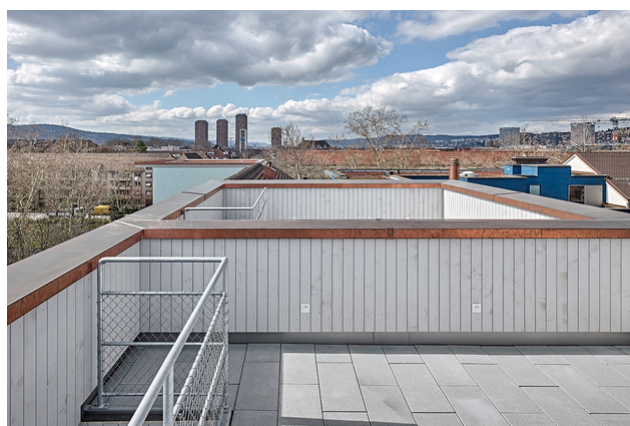
Terrasse sur le toit