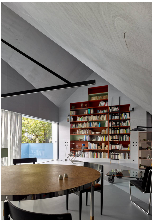
Salle de séjour