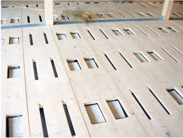
Remplir la signature d'ouverture Silence