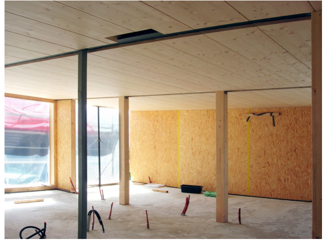
Supports en bois