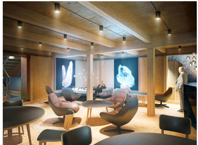
Visualisation de l'intérieur du salon