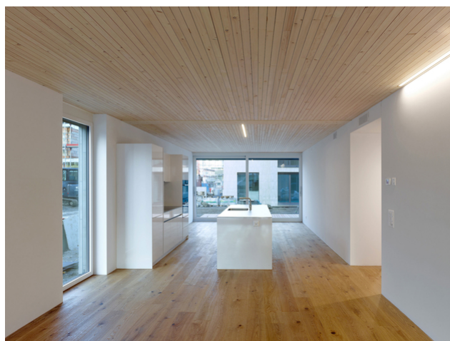
Ilot de cuisson