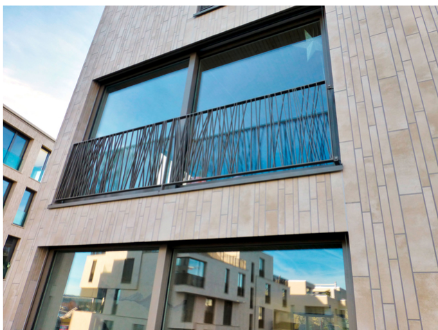
Extrait de la façade