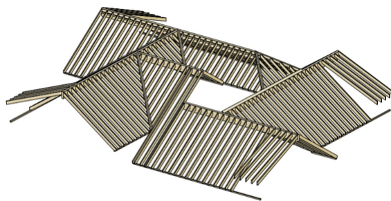
Vue MFH 3D