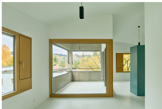
Vue sur le balcon