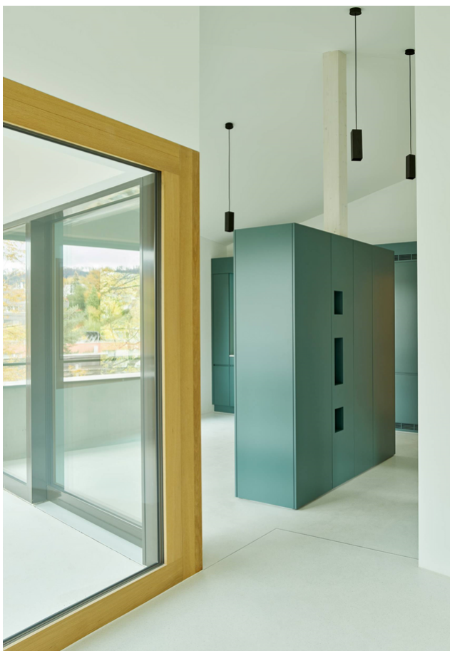
Passage salon - cuisine