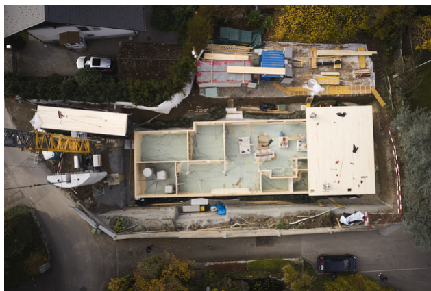
Prise de vue aérienne de la cave en bois