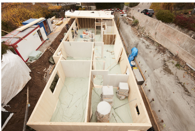
Cave en bois