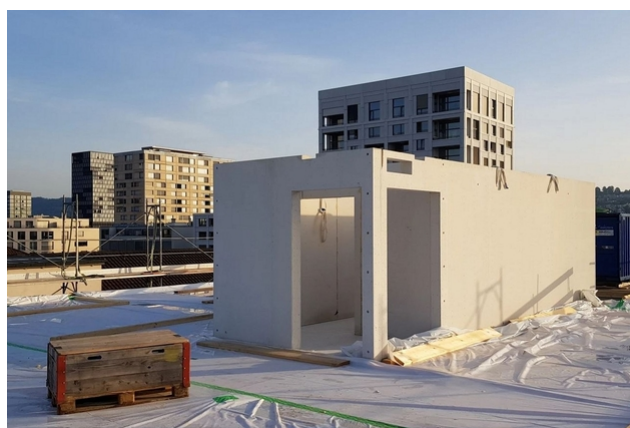
Cage d'escalier en cours de construction