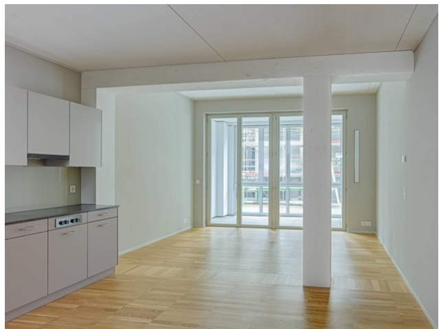
Vue intérieure de l'appartement termin

Raccordement du plafond de l'étage au noyau de la cage d'escalier