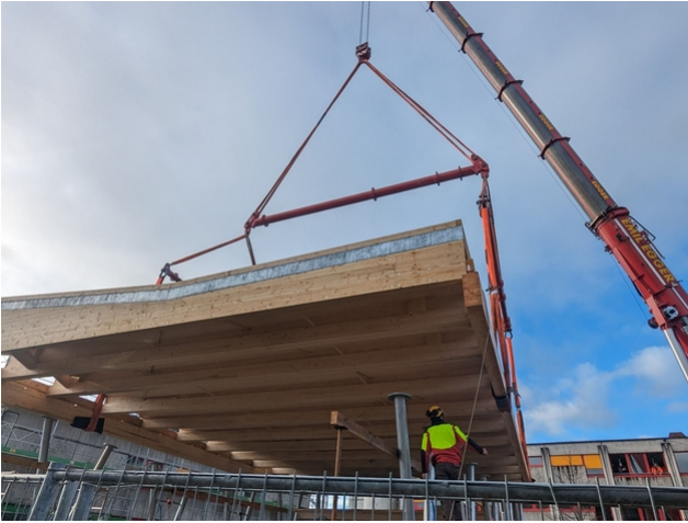
Pose des dalles collées sur la structure intermédiaire.