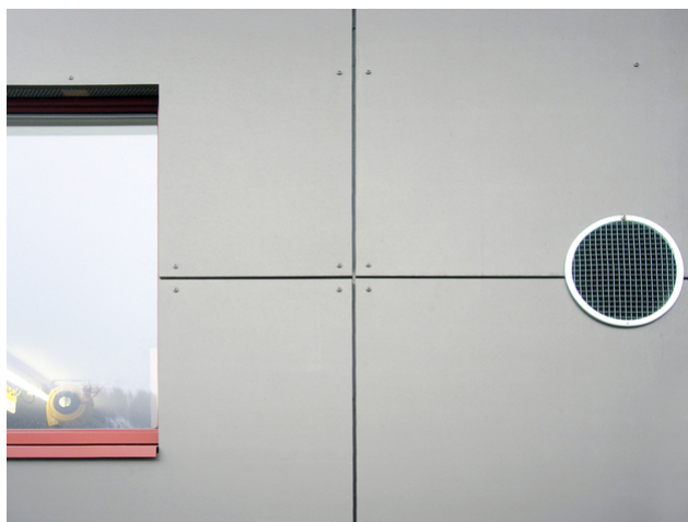
Vue détaillée de la façade