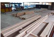
Plate-forme de travail Flück Holzbau AG, Wangen

La Simmental Arena, la nouvelle salle multifonctionnelle de Zweisimmen, est composée en grande partie de bois suisse. De plus, elle n'a pas besoin de piliers à l'intérieur. Le toit est soutenu par dix fermes en arc de 38 mètres de long., Zweisimmen