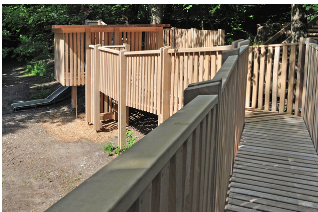
L'aire de jeux offre une multitude de possibilités de jeux