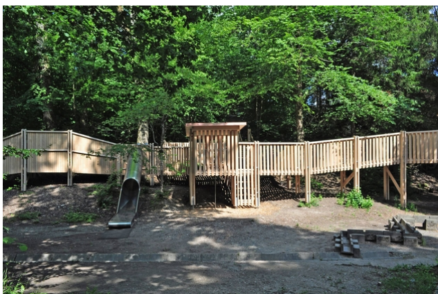
La nouvelle aire de jeux mesure 48 mètres de long et 42 mètres de large, la tour est haute de 7 mètres.