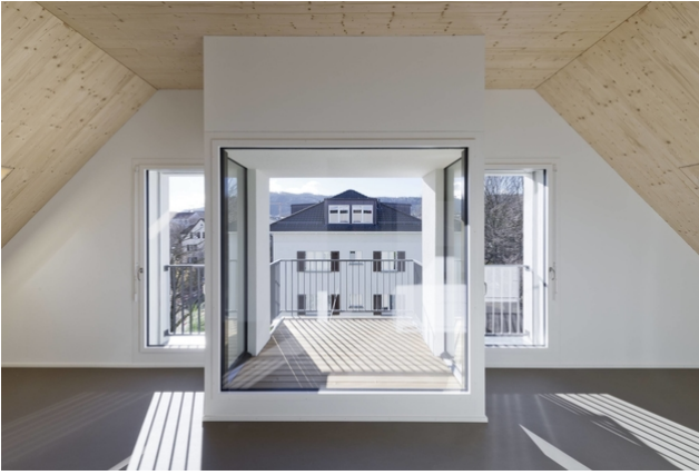
Aussicht aus Balkon mit innenliegendem Atrium