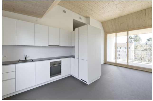
Gelungene Kombination der Materialien in der Küche